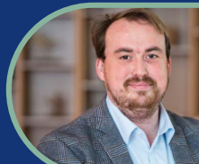
De pedagogische ruimte