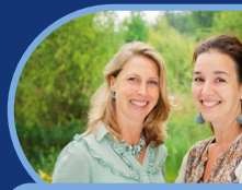
Onderwijsvragen Operation Education