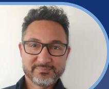
Mens en technologie