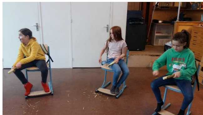
In klas 5 krijgen de kinderen les in houtbewerking.