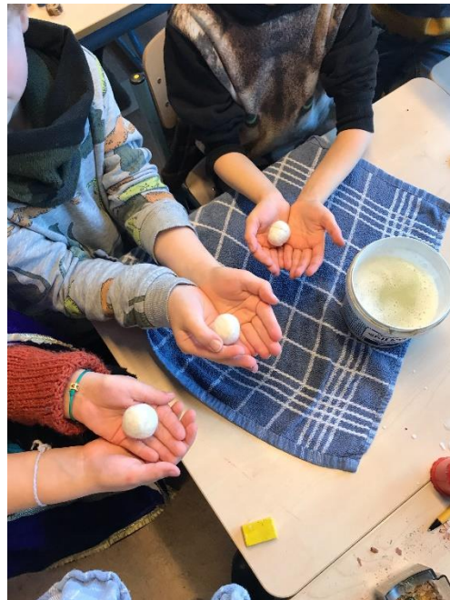
Een krokus van papier en van vilt. Op de foto het zgn. nat-viltten.