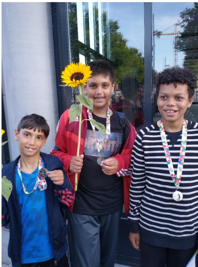
Gezelligheid troef tijdens de avondvierdaagse