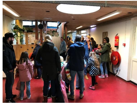
In de rij voor een heerlijke tosti.